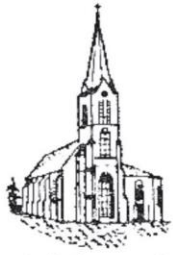
Spahnharrenstätte St. Johannes der Täufer