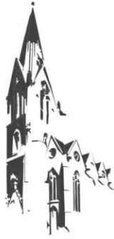
Sögel St. Jakobus