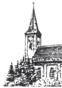
Stavern St. Michael